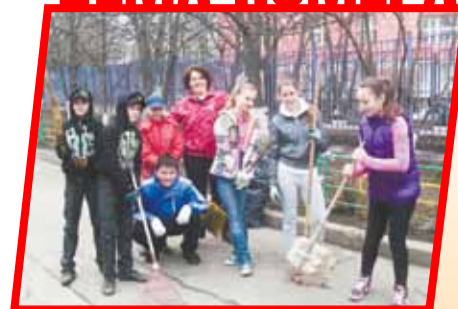
В Москве объявлен месячник по благоустройству, а 12 и 26 апреля горожан призывают с метлами и лопатами помочь навести порядок в столице.