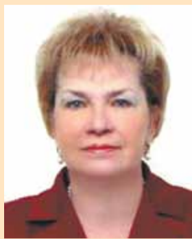
Уважаемые работники и ветераны военных комиссариатов!