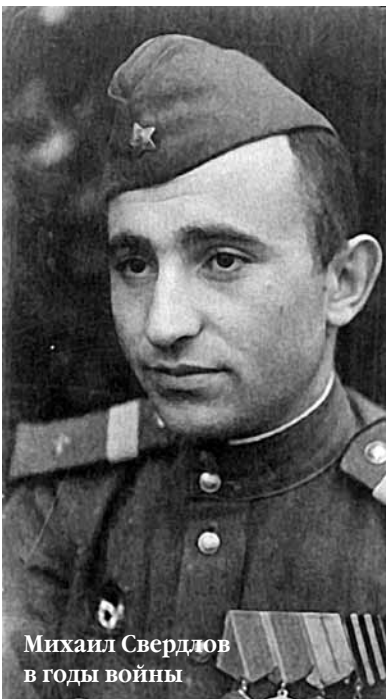
Михаил Свердлов в годы войны

— Кормили нас плохо, — рассказывает ветеран. — В отличие от летного состава, технический состав питался